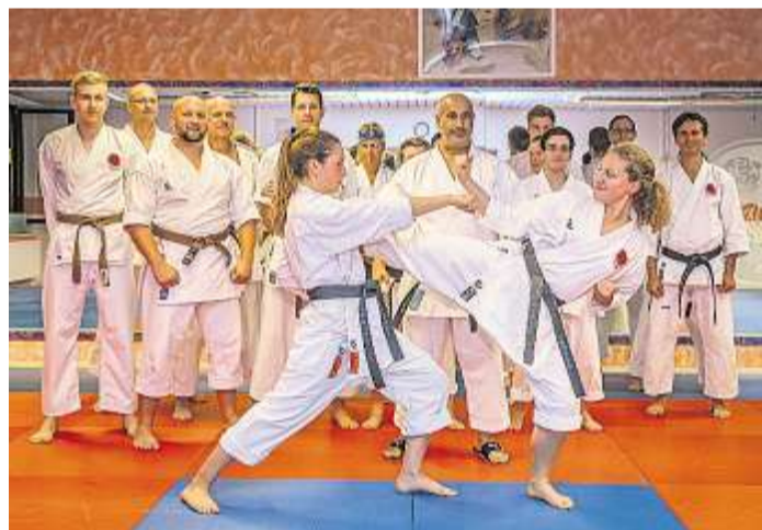
In der Karate Akademie Regensburg wird authentisches, traditionelles Karate gelehrt. Ziel ist es, sich in einer Notsituation auch unbewaffnet verteidigen zu können.

Dabei waren die Anfänge hart: Mit gerade einmal drei Schülern in einem 60 Quadratmeter-